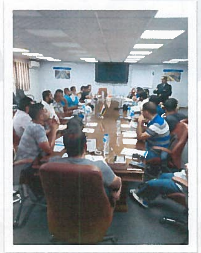
الدورة الأساسية لنظم إدارة الجودة للمهندسين المرشحين للتزقي (مشروع مونوريل السادس من أكتوبر)