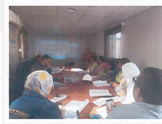
البرنامج الأساسي للسلامة والصحة المهنية للمهندسين المرشحين للتزقي (مشروع محطة الحاويات العملاقة بميناء دمياط)